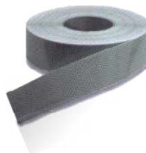
Kodowe pasy odblaskowe