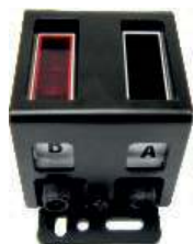
Czujniki wykrywania kodu